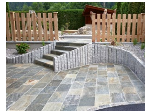
Terrassen- und Wegeanlagen zieren den Garten, Seerosen und Wasserpflanzen den Naturpool.