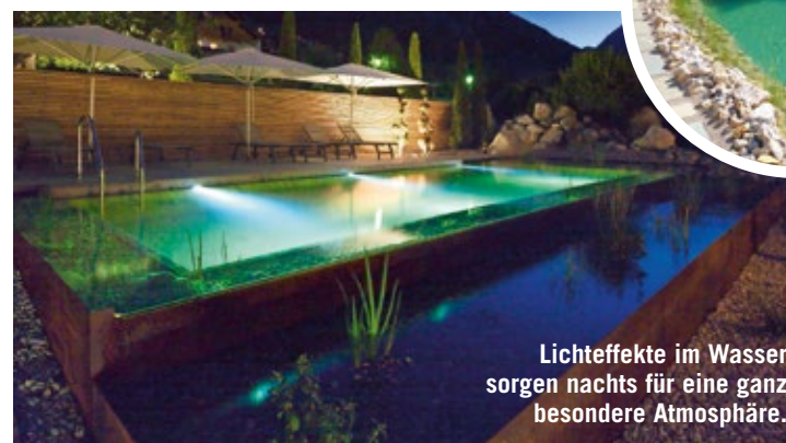
Lichteffekte im Wasser sorgen nachts für eine ganz besondere Atmosphäre.