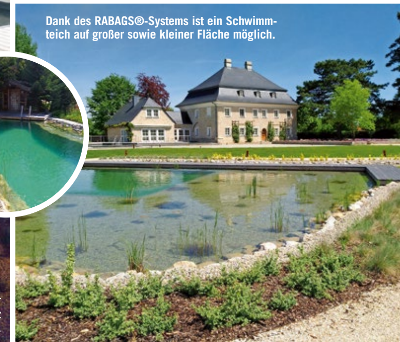
Dank des RABAGS®-Systems ist ein Schwimmteich auf großer sowie kleiner Fläche möglich.