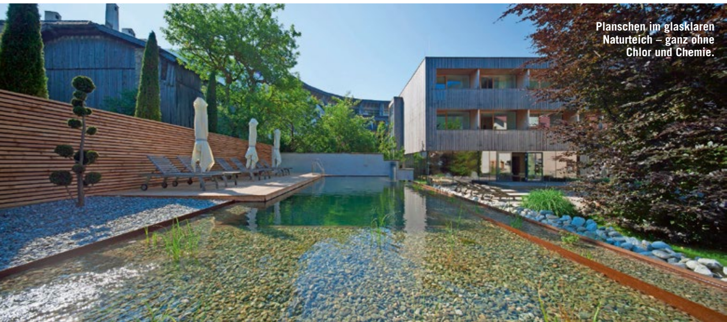
Planschen im glasklaren Naturteich – ganz ohne Chlor und Chemie.